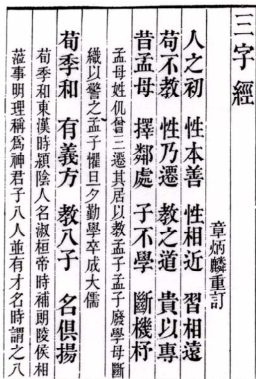
Fig.3: La primera página de una edición moderna de El clásico de los tres caracteres , con el título del libro en el ángulo superior derecho y el texto mismo que se inicia en la tercera línea. El comentario aparece en tipografía más pequeña.

obras lexicográficas, sobresaliendo el Ku-chin T'u-shu Chi-ch'eng (una síntesis ilustrada de los tiempos antiguos y modernos), el Ming-shih (Historia de los Ming) y el famosísimo K'ang-hsi Tzu-tien (Diccionario enciclopédico K'ang-hsi ).