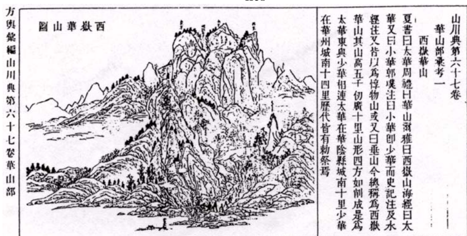
Fig. 6: La enciclopedia Ku Chin T'u Shu Chi Ch'eng (1725) reproduce en el capítulo de geografía numerosos grabados en madera de las principales montañas, ciudades, monasterios y paisajes de especial interés. En esta ilustración se muestra el monte Hua Shan, en la prov. Shensi. Desde el período más remoto de China se lo venera como uno de los cinco picos sagrados, en los que se diseminaron numerosos monasterios taoistas y budistas cuyos nombres se indican en la figura. El punto más elevado de esta orografía llega a los 1997 metros.

Esta enciclopedia está íntegramente dedicada al jade. Dividida en 28 secciones, a su vez con subdivisiones por item , en todos los casos hay encabezamientos de dos caracteres, uno de los cuales es yü (= jade). Incluye los nombres, apariencia y calidades de jade; detalles